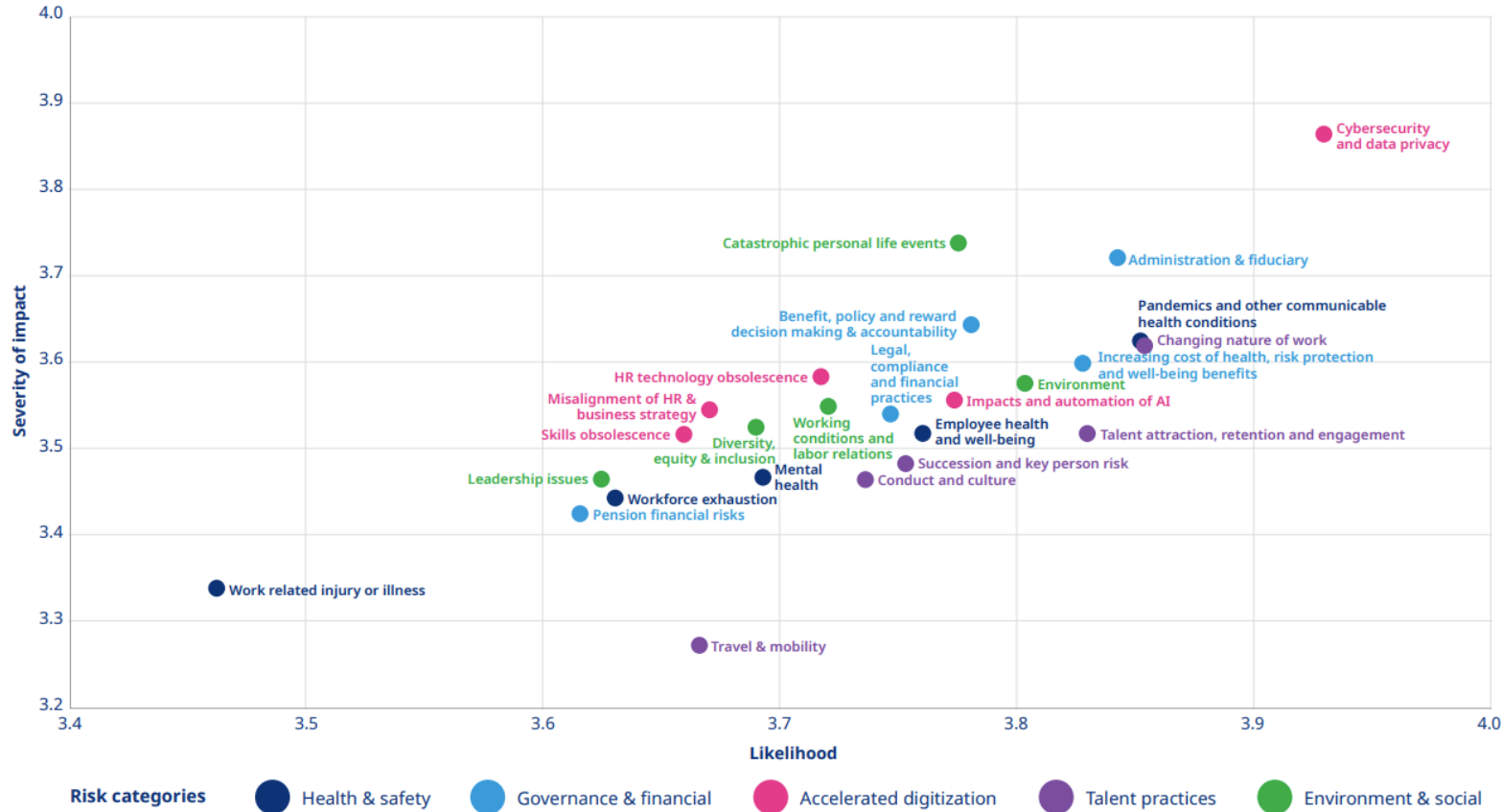
Figure 8: Likelihood and impact of people risks a

Risk categories Health & safety Governance & financial Accelerated digitization Talent practices Environment & social